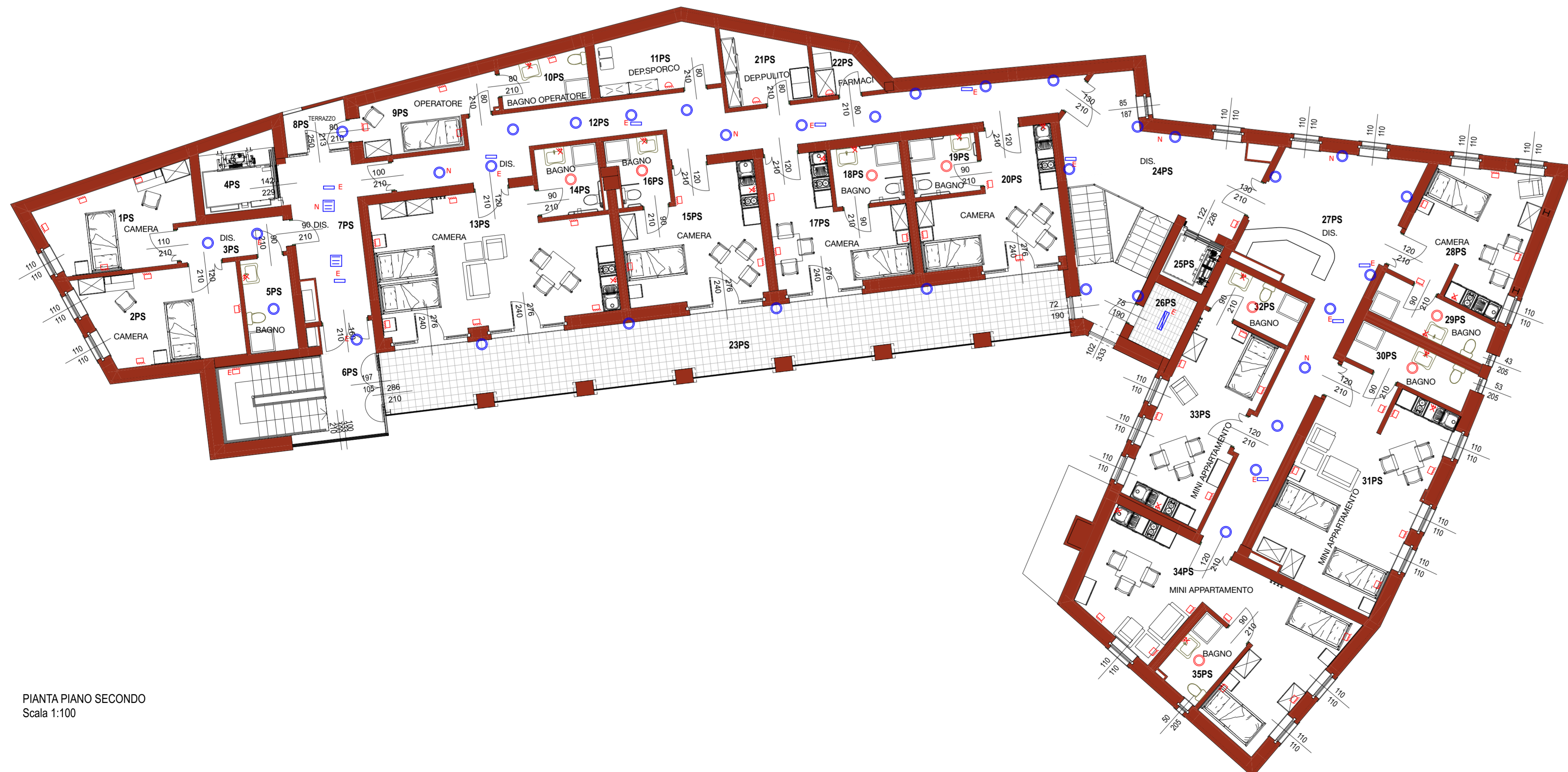
PIANTA PIANO SECONDO Scala 1:100