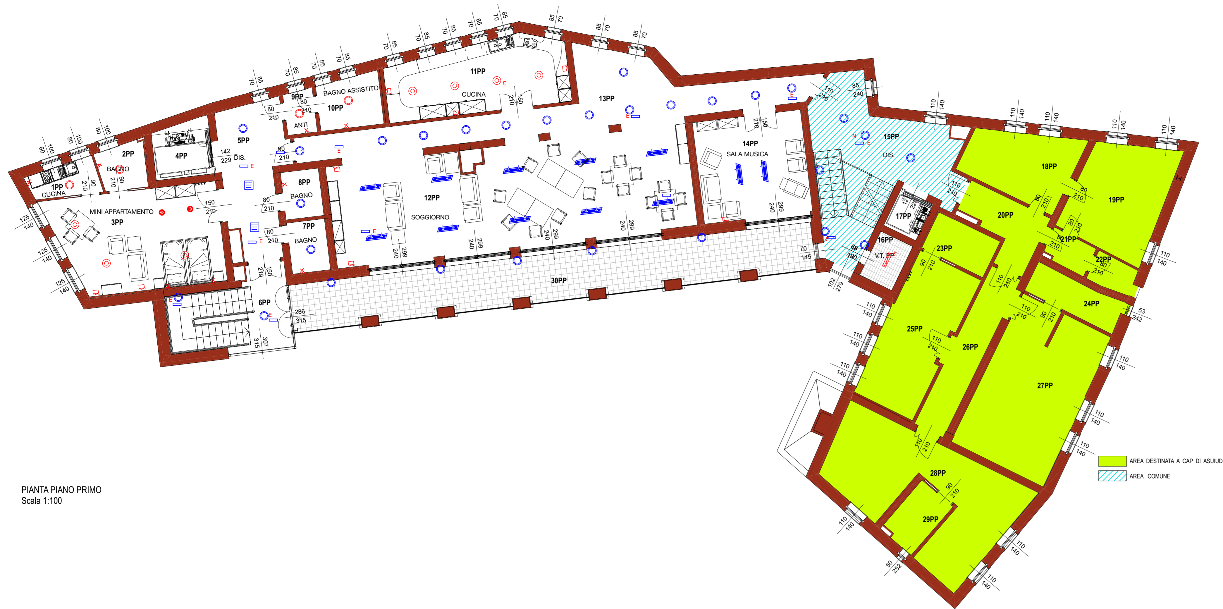
PIANTA PIANO PRIMO Scala 1:100